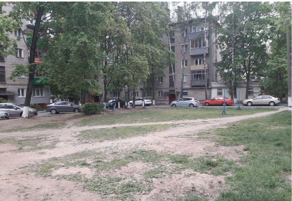
А в этом дворе (ул. Декабристов, д. 18, 20, пр. Макаренко, д. 12) был пустырь

В прошлом номере «Спутника» мы подробно рассказали о том, как в Королёве идёт работа по благоустройству придомовых территорий.