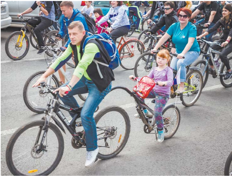
Юные и взрослые участники велопробега

Эльмира Хаймурзина, заместитель председателя правительства Московской области: «Королёв – один из моих любимых городов Подмосковья: творческий, умный, яркий, молодой!»