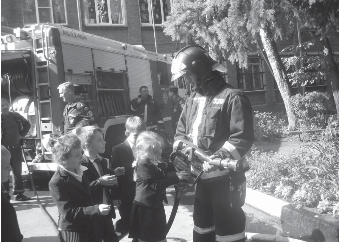
Детям интересна пожарная техника

В НАЧАЛЕ НОВОГО УЧЕБНОГО ГОДА В КОРОЛЁВСКОЙ ШКОЛЕ № 22 ПРОШЛИ ПОЖАРНЫЕ УЧЕНИЯ. МЕРОПРИЯТИЕ БЫЛО ПРОВЕДЕНО ДЕЖУРНЫМ КАРАУЛОМ 329 ПОЖАРНОЙ ЧАСТИ МЫТИЩИНСКОГО ТЕРРИТОРИАЛЬНОГО УПРАВЛЕНИЯ ГКУ МО «МОСОБЛПОЖСПАС» В РАМКАХ МЕСЯЧНИКА БЕЗОПАСНОСТИ. ЦЕЛЬ – ОТРАБОТКА ЭВАКУАЦИИ И СПАСЕНИЯ ЛЮДЕЙ НА ОБЪЕКТЕ С МАССОВЫМ ПРЕБЫВАНИЕМ ДЕТЕЙ.