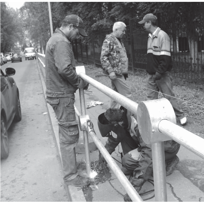
Установка ограждений у гимназии № 5