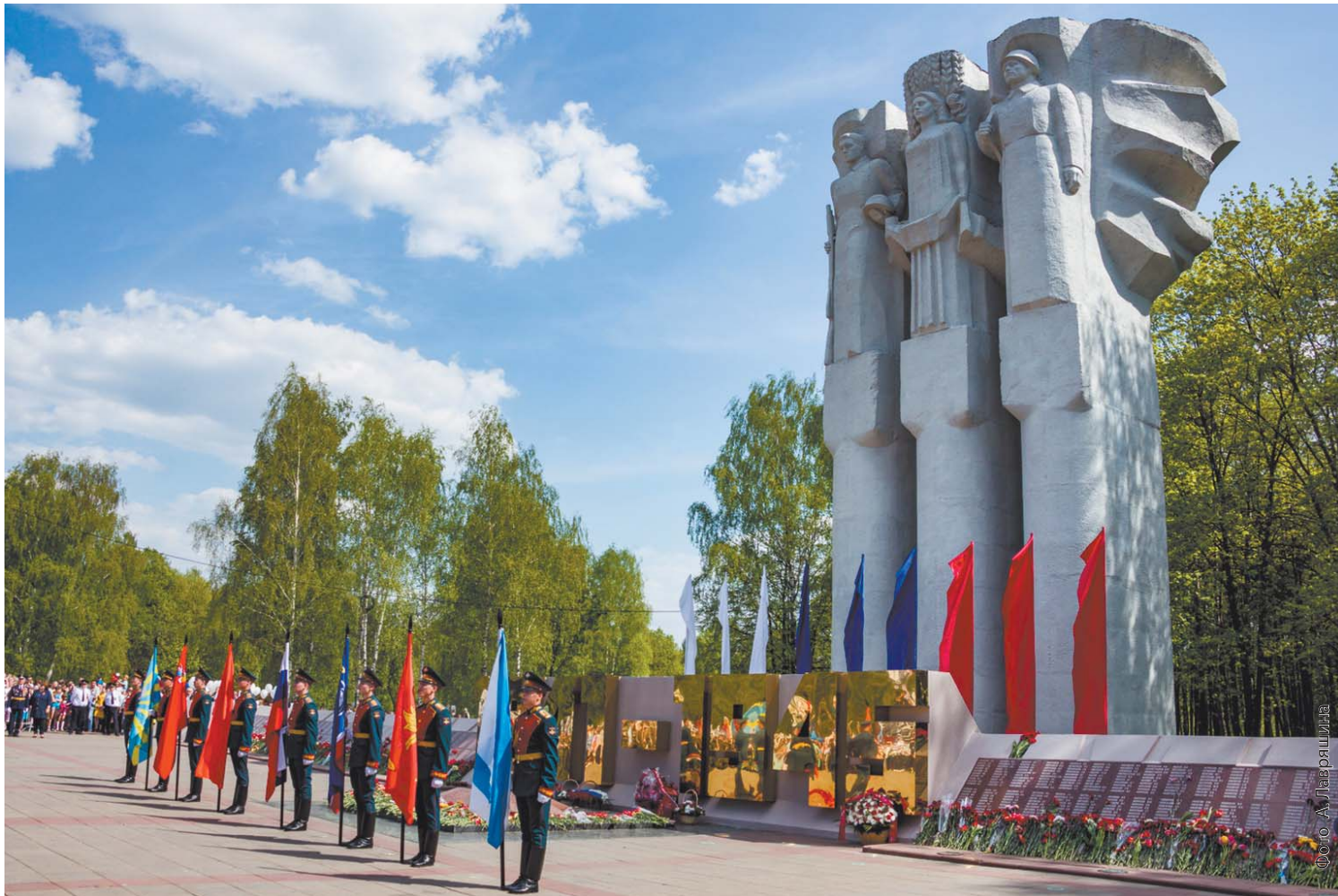
За мужество, проявленное королёвцами в годы войны, наукограду присвоено почётное звание «Город Трудовой Доблести и Славы»