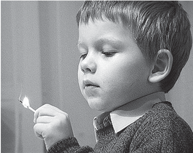
Спички детям не игрушки

– рассказывайте детям о пожаробезопасном поведении;