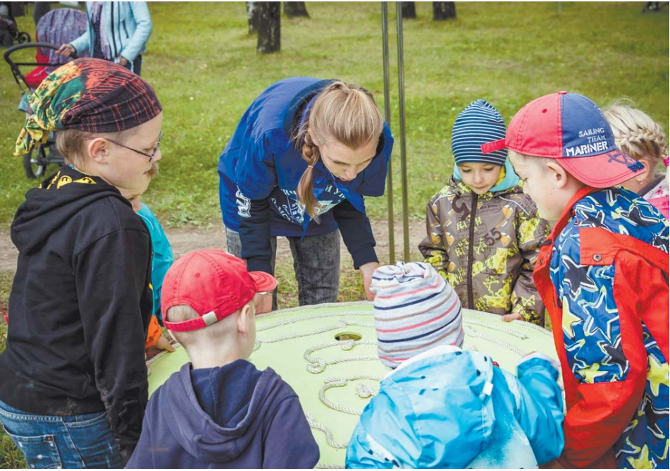
Мастер-классы провели студенты Технологического университета

«Путёвка в жизнь: о трудовой коммуне Болшево», открытая только в начале лета. Гостями выставки в День города стала делегация из белорусского города-побратима Червеня.