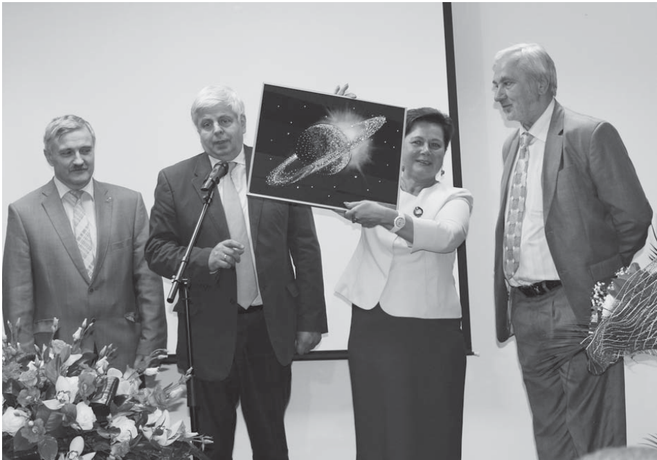
Группа космонавтов вручила коллективу МСЧ № 170 подарок – изображение планеты Сатурн