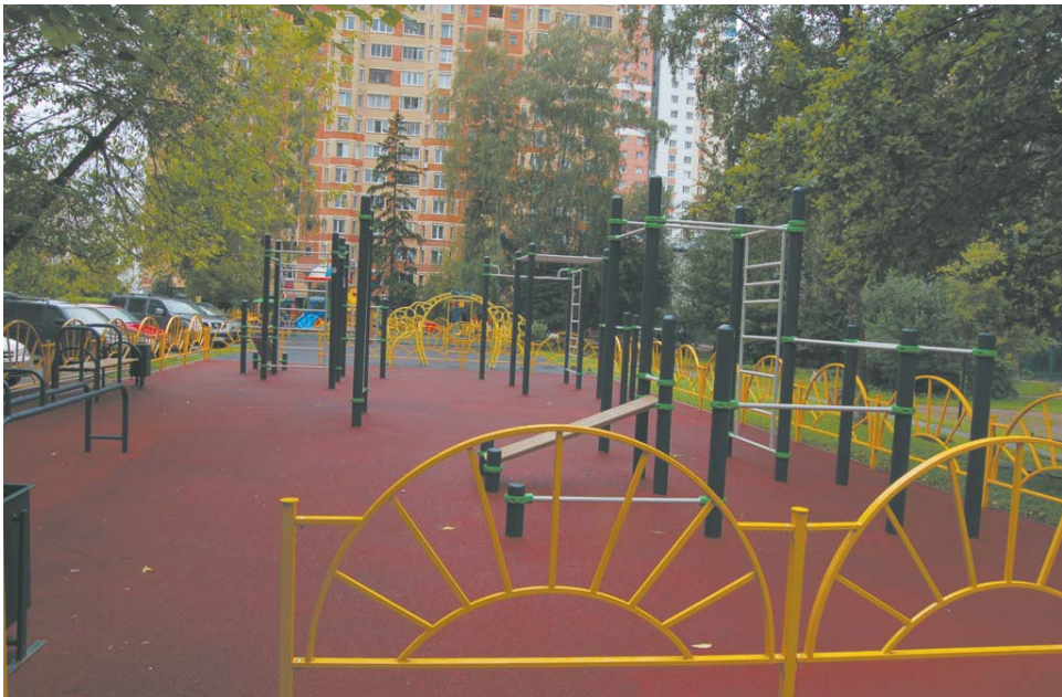
Теперь, кроме новой детской площадки, здесь ещё появились тренажёры для воркаута