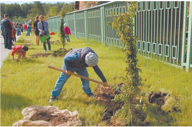
Ученики озеленяют территорию новой школы