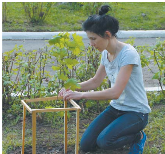
Королёвцы рады сделать свой город ещё зеленее