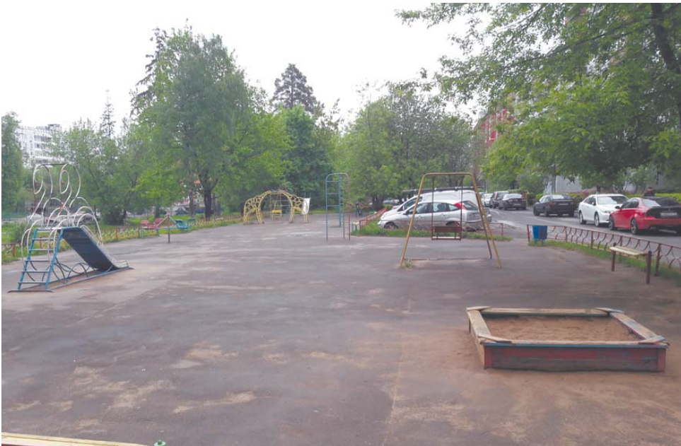
Так выглядела детская площадка во дворе домов № 13, 17, 19 по ул. Пушкинской